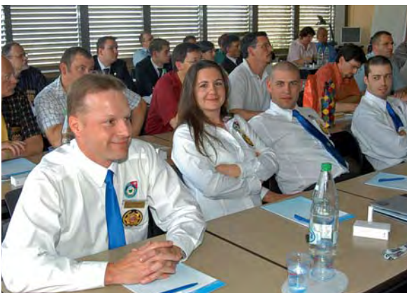
Délégués IPA Vaud